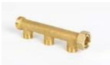
1/2"x3/4" Fordeler med løpemutter og teflonpakning.

Material som er benyttet er drikkevannsgodkjent messing. Teknisk godkjenning: TG 20359 2014 (SINTEF Certification 20359). Produktsertifikat nr. 0086 (R09).